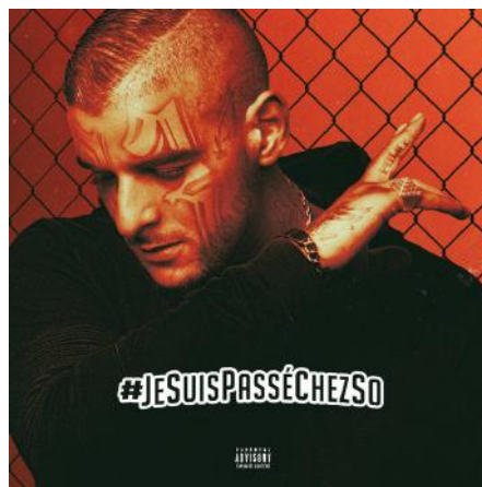
Pochette de l'album #JeSuisPasséChezSo

en passant par la cité rouge du 19ème arrondissement de Paris, l'artiste a distillé sa frappe auditive avec hargne et détermination. Dans une volonté d'unir de la meilleure des manières son département, il a rassemblé tout ce que la Seine Saint-Denis