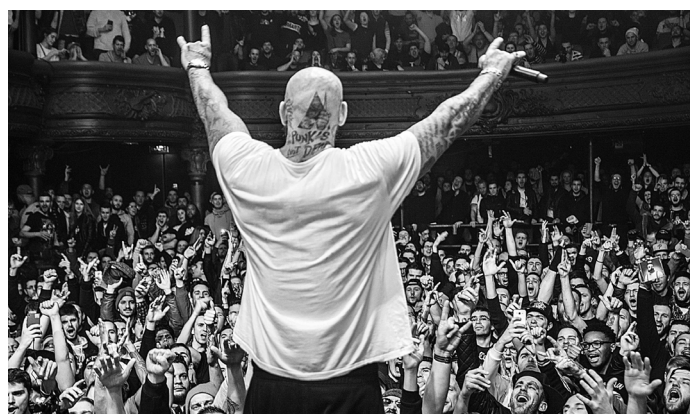
Concert à la Cigale 2017